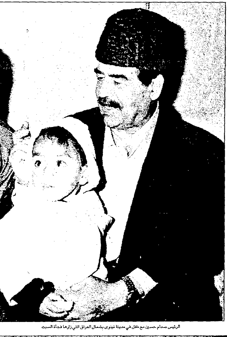
الرئيس صدام حسين مع طفل في مدينة تينوي بشمال العراق التي زارها فجأة السبت